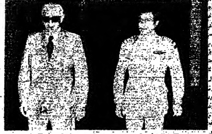
الرئيس شمعون يتفقد القصر مساء امس

زار الرئيس كميل شمعون القصر الجمهوري عند الساعة السادسة والنصف من مساء امس، وقال بعد اجتماعه مع الرئيس سليمان فرنجية: الحديث موضوع الساعة، من الحكومة طبعاً. وأضاف: تبادلنا الرأي مع نخبة الرئيس بخصوص تكليف الحكومة. وسئل: هل يطمح شيئاً مستهدداً كالإسماء مثلاً فأجاب: ما صار بيت بالأشخاص لأن البيت بالأشخاص غير صعب، فقط بالأيدي. وقال الرئيس شمعون بأن هناك مساعي إذا كان بعد وقت جبلاط الآخر وسئل إذا كان قد جرى الاتصال به بهذا الخصوص. وسأل شمعون: شو يقول صريح جبلاط الآخر. وبعداً استمرح من الصحافيين عن موقف جبلاط قال: نحن كسان مش مشاهدين الاشتراك بالحكومة، ولكن البقية على ص ١٤ عمود ٥.